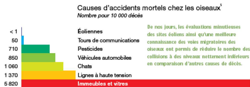
Figure 1 : Causes d'accident mortel chez les oiseaux https://energie-verte.blogspot.com/2007/01/eoliennes-et-oiseaux.html

L'éolien est loin d'être une cause majeure de la mortalité des oiseaux et chauves-souris car pour être autorisés, les projets de parcs éoliens doivent prouver qu'ils n'auront pas d'incidence sur l'ensemble des espèces susceptibles d'être présentes sur le site d'implantation, par la mise en place de mesures environnementales. Ils sont également contrôlés tout au long de leur exploitation pour s'assurer de l'absence d'impact tout au long de la vie du parc éolien.